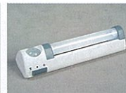
LEDセンサーライト(1本)