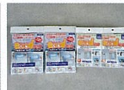
簡易トイレ(男女用各2)