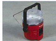
非常用ランタン(1コ)