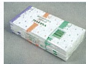
ティッシュペーパー(12コ)