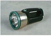
ハロゲンライト(1台)