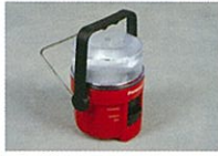
非常用ランタンライト(1台)