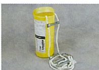
避難ロープハシゴ(7.7m・1台)