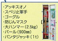
救助工具箱 レスキュースリム