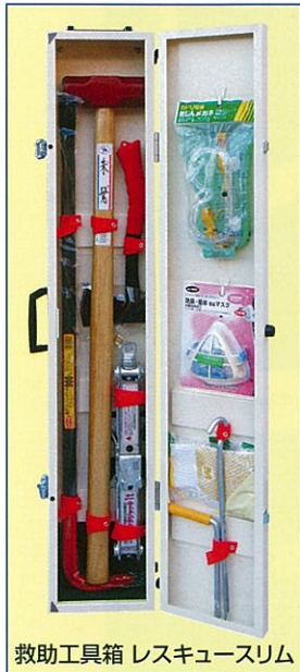
救助工具箱 レスキュースリム