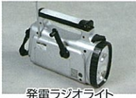
発電ラジオライト (電話充電機能付・1台)