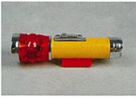
マグネット付懐中電灯(1台)